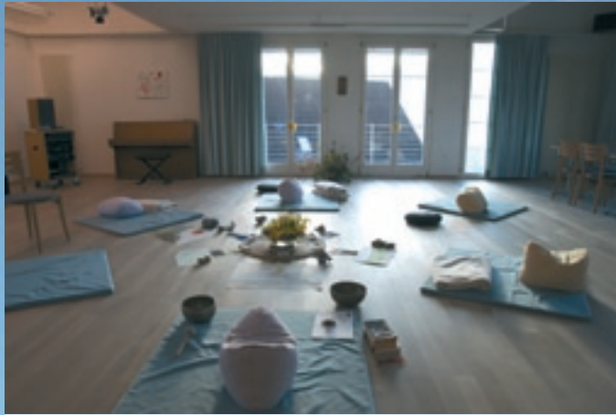
Unser Saal lässt sich auf viele Arten gestalten und die Technik entspricht dem Standard für Seminarhotels.