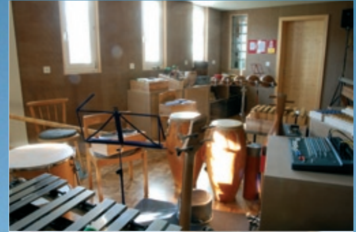
Der Musik- und Klangraum ist für intensive Sessions mit vielen Instrumenten und Klängen eingerichtet.